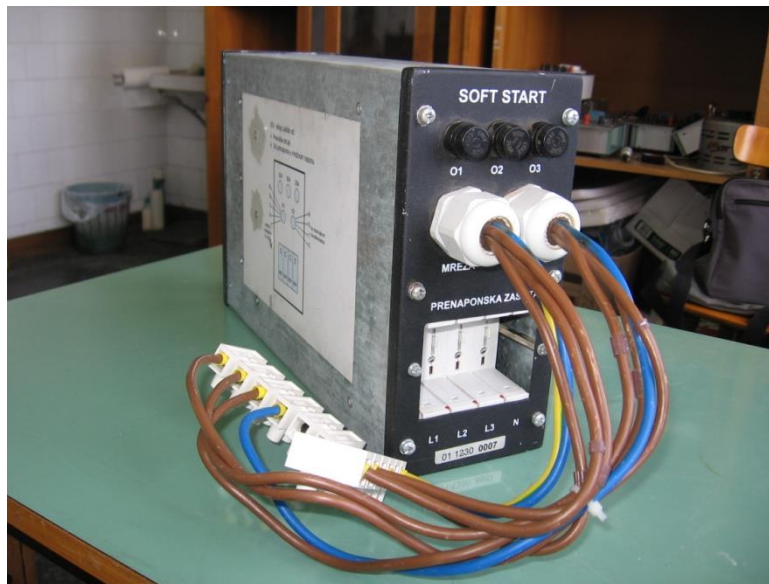
Слика 2: Изглед уређаја